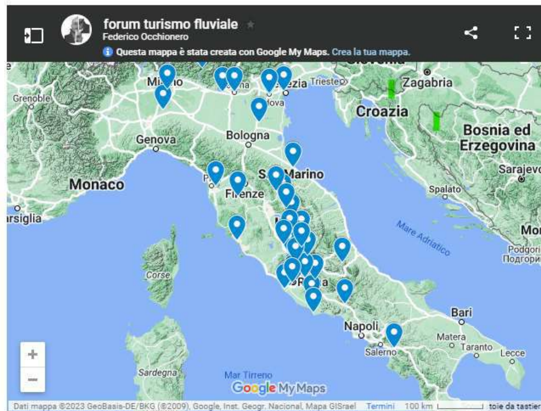
Mappa degli interventi al Forum

https://www.reginaciclarum.it/wordpress/?p=24967#VideoSintesi