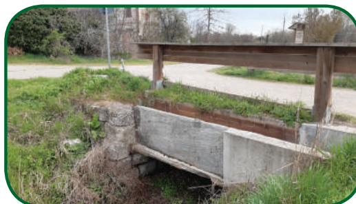
Nodo idraulico nei pressi di Cascina S. Bernardo: dove vanno le acque?