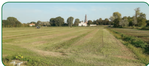
Marcita: da dove arriva l'acqua che bagna la marcita e come si distribuisce?