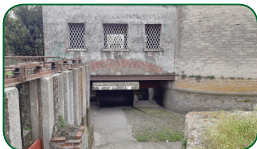
Manufatto Gregotti: come si misura l'acqua

Domenica 29 settembre 2024 - dalle ore 15:00 alle 18:00